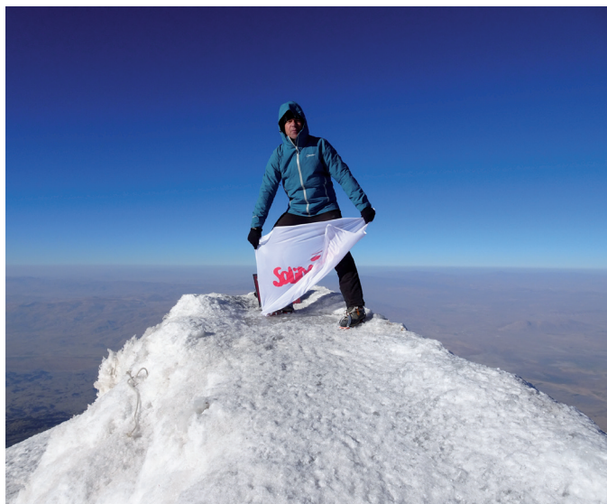
Flaga NSZZ „Solidarność” na szczycie Araratu