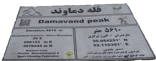
Damavend (ostatni król Persji) jest najwyższym szczytem Iranu (5610 m.) i najwyższym wulkanem Azji, zaliczanym do

Korony Ziemi Wulkanów. Wybitnie góruje w swoim paśmie, w którym drugi szczyt jest o prawie tysiąc metrów niższy. Góra jest wyjątkowo piękna robiąca ogromne wrażenie swoją wybitnością i dużym nachyleniem stoków.