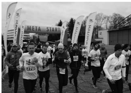
Tropem wilczym biegli także kolejarze z NSZZ „Solidarność”.