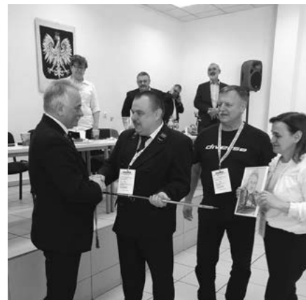
Szabla i karykatura od koleżanek i kolegów związkowców dla „Wodza Zdzisława”

Piotr Pazera