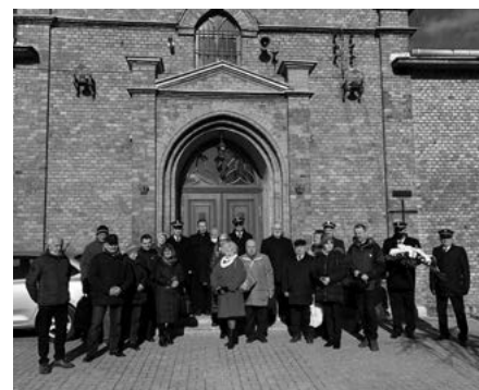
Pamiątkowe zdjęcie przed kaplicą na cmentarzu Kule.