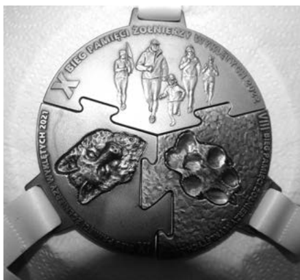
Medale z trzech ostatnich edycji Biegu Tropem Wilczym po połączeniu tworzą krążek średnicy 11 cm z grafiką i opisami poszczególnych edycji.

Jedną z form pamięci o Żołnierzach Wyklętych (Niezłomnych) jest Bieg Tropem Wilczym organizowany od 2013 r., w bieżącym – 6 marca br. Ma charakter ogólnopolski. Jest przygotowywany także przez Polaków mieszkających poza granicami kraju i naszych żołnierzy służących w misjach. W bieżącym roku dziesiątki tysięcy osób, wśród nich także kolejarze z NSZZ „Solidarność”, biegało tropem wilczym w ponad tysiącu miejsc.