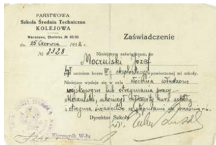
Zaświadczenie Państwowej Szkoły Średniej Technicznej Kolejowej z 25 czerwca 1932 r.